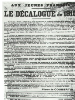
Coubertin, " Dekalojia 1915 : Kwa vijana wa Ufaransa"