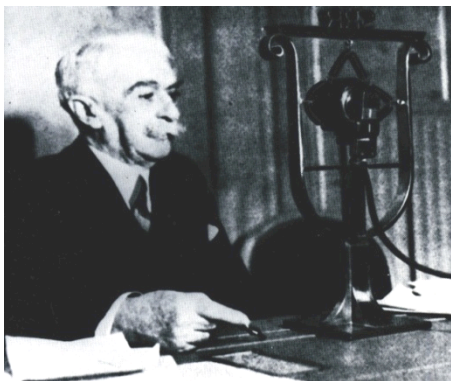
Akitangazia vijana Wamarikani redioni mwaka wa 1934

Mnamo 1890, Coubertin alitoa wito kwa mageuzi ya utaratibu wa asili. Anasema kuwa, ' Hakuna mageuzi ya kisiasa, kiuchumi au kijami yanayoweza kuwa ya manufaa bila mageuzi ya kwanza ya pedagogiska. '