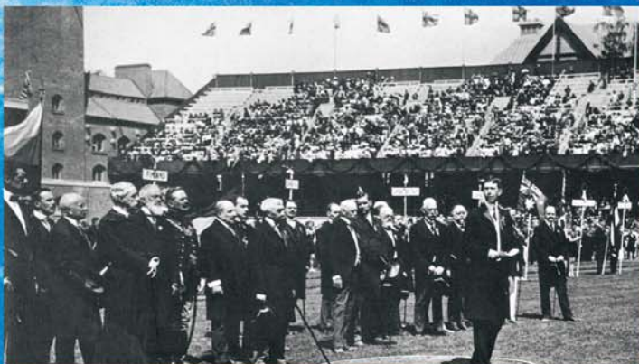
Olümpiamängude avatseremoonia Stockholmis 1912. aastal.

"Neljandate Olümpiamängude künnisel oli tarvis nõu pidada, mil määral ja millisel kujul saaksid Kunst ja Humanitaaralad osaleda kaasaegsete Olümpiamängude pidustustel ja üldisemas plaanis osaleda spordis, et ise sellest võita ja ühtlasi sporti õilistada."