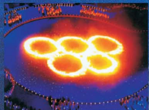
Talioolümpiamängud Salt Lake City's 2002. aastal - Pierre de Coubertin rõhutas Olümpiamängude avamis- ja lõputseremooniade tähtsust. See traditsioon kestab tänapäevalgi.

"Neljandate Olümpiamängude künnisel oli tarvis nõu pidada, mil määral ja millisel kujul saaksid Kunst ja Humanitaaralad osaleda kaasaegsete Olümpiamängude pidustustel ja üldisemas plaanis osaleda spordis, et ise sellest võita ja ühtlasi sporti õilistada."