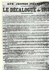
Coubertini: Dhjetë urdheresat e rinisë së vitit 1915.