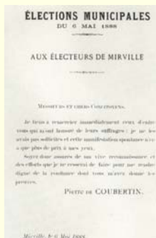
Zgjedhjet komunale në 6. Maj 1888 për qytetarët e Mirville

Në 1925 ai themelon Unionin Universal Pedagogjik, rezultatet e të cilit - të hartuara në katër gjuhë - u bënë të njohura internacionalisht nëpërmjet origjinalitetit dhe realizmit që i karakterizonte.