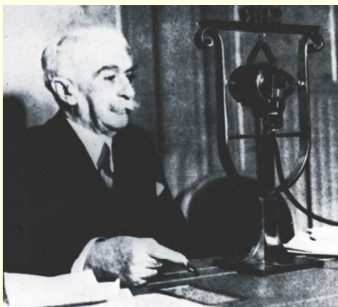
Ketu gjate nje transmetimi te radios nje ligjerate drejtuar rinise amerikane te vitit 1934.

Për Coubertin lojrat olimpike përbëjnë një pjesë të rëndësishme të formimit të personalitetit dhe të ruajtjes së lirisë.